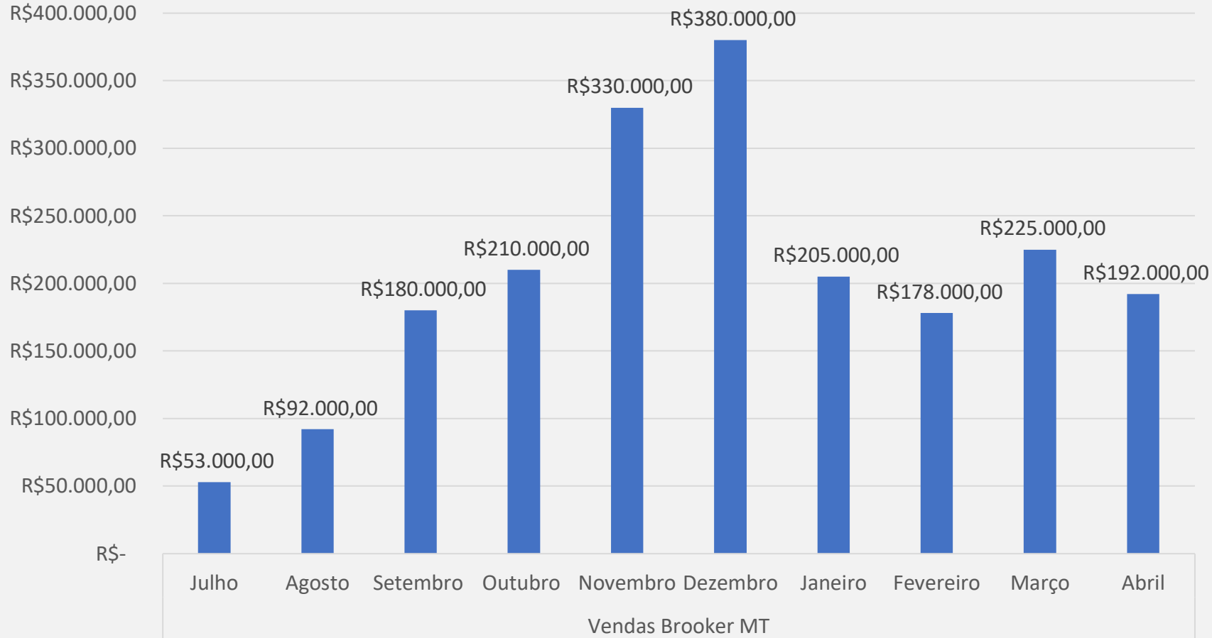
Título do Gráfico

Gráfico de vendas de um cliente. Queda na venda a partir de janeiro em função de ruptura no fornecimento.