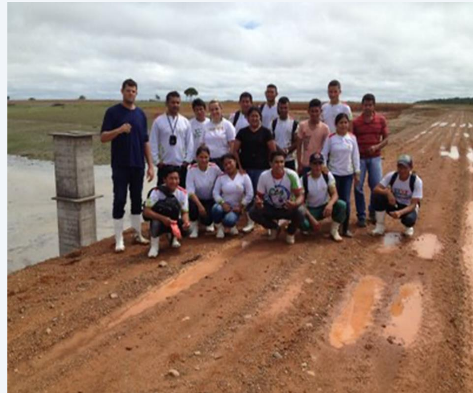
PROJETO SÁBEDIAS DO PFCR VISITAÇÃO À BARRAGEM DO PFCR