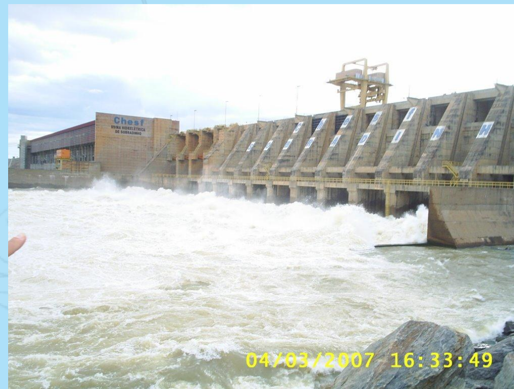
Sobradinho – Brasil