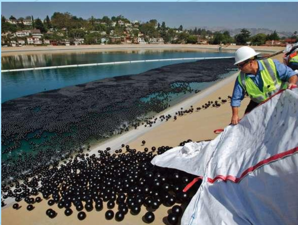
Califórnia – EUA

RIO GRANDE DO NORTE GOVERNO DO ESTADO SECRETARIA DE ESTADO DA AGRICULTURA, DA PECUÁRIA E DA PESCA - SAPE