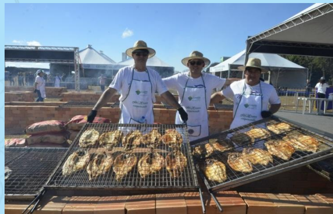
Festival em Brasília/DF