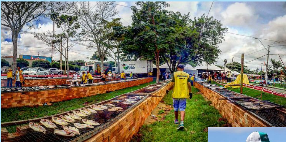
Festival em Ariquemes/RO