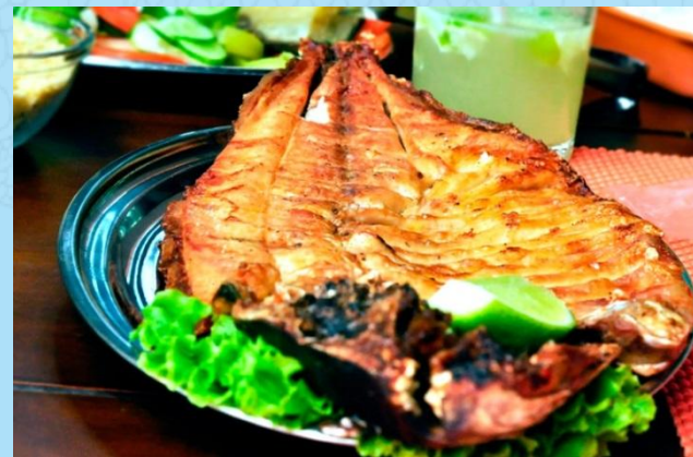
Banda sem espinha