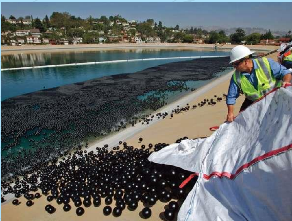
Califórnia – EUA

RIO GRANDE DO NORTE GOVERNO DO ESTADO SECRETARIA DE ESTADO DA AGRICULTURA, DA PECUÁRIA E DA PESCA - SAPE