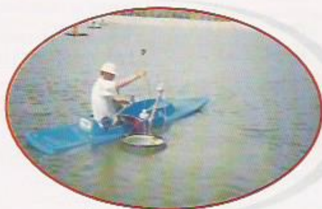
Figura 20: Arraçoamento

Quanto ao manejo alimentar como estratégia de reduzir o estresse, a poluição do ambiente de cultivo e as perdas econômicas com as altas taxas de FCA, deve-se considerar: