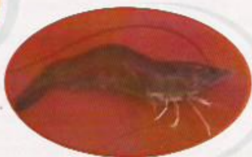
Figura 24: Grau UM (G-01)