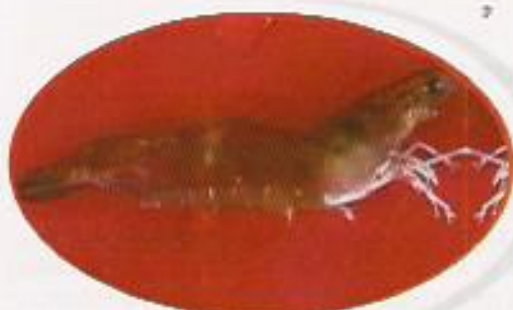
Figura 25: Grau DOIS (G-02)