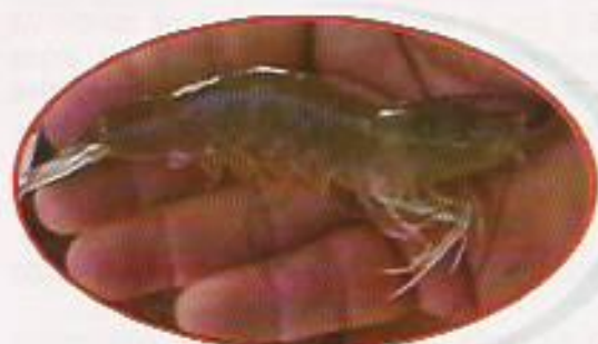
Figura 23: Grau ZERO (G-00)

A análise de prevalência indicará a evolução visual da enfermidade e seu resultado servirá para tomar decisões sobre estratégias de alimentação e de despesca emergencial. Nas figuras de 23 a 27 encontram-se características sugestivas do grau de severidade do IMNV que pode ser observado em qualquer dos segmentos do abdômen do camarão.