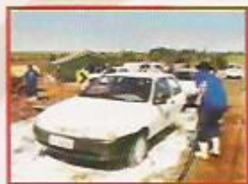
Figura 1: Sanitização com Fumigador.

O controle do acesso de funcionários e visitantes e a prática de sanitização na entrada da fazenda eliminam uma das formas de transmissão de doenças e de contaminantes.