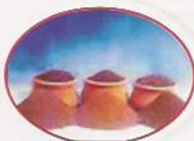
Figura 5: Amostras de Ração