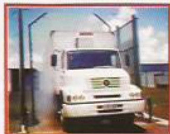
Figura 3: Arco Sanitário.

As Figuras de 1 a 3 apresentam sistemas de desinfecção em veículos na entrada da fazenda. O controle dos veículos e o uso de rodolúvel e arcos sanitários são importantes como formas de exclusão de vetores de doenças.