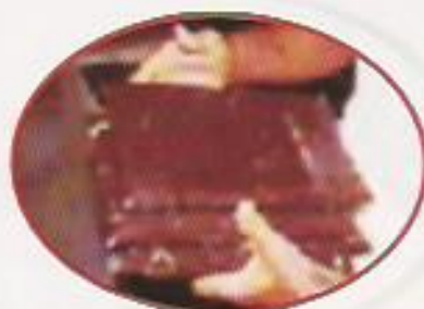
Figura 6: Biomassa de Artemia Congelada