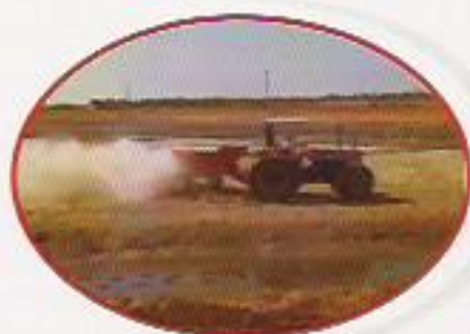
Figura 17: Distribuição Mecanizada de Calcário