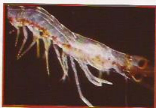
Figura 12: Pós-larva.