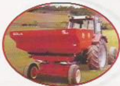
Figura 7: Distribuidor de Calcário