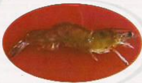
Figura 26: Grau TRÊS (G-03)