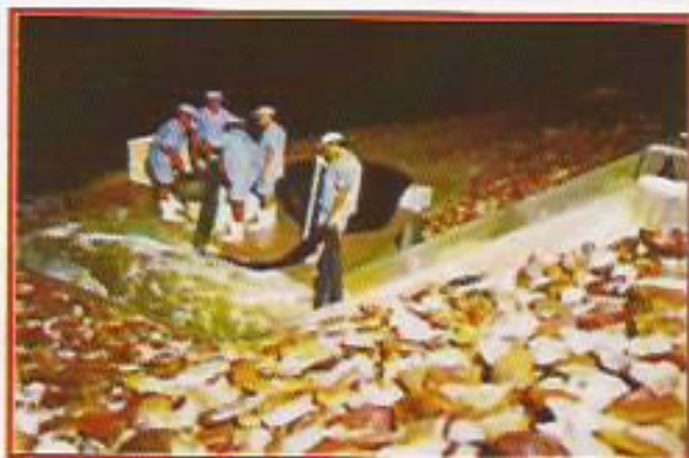
Figura 28: Operação de Despesca