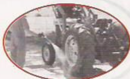
Figura 9: Sanitização de Equipamentos