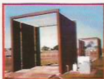
Figura 2: Arco Sanitário.