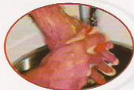
Figura 10: Sanitização das Mãos