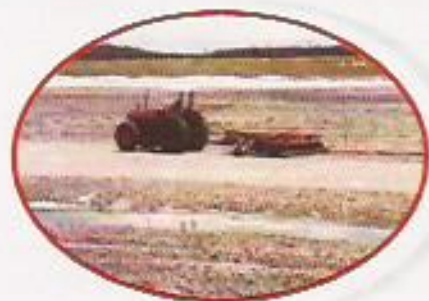
Figura 16: Revolvimento Mecanizado

• Vale lembrar que o uso do óxido e hidróxido de cálcio só deve ser feito quando as análises comprovarem sua necessidade, posto que, dependendo da dosagem, os mesmos podem atuar como algicidas e bactericida, podendo influir negativamente na produtividade primária do viveiro e comprometer o seu desempenho em termos de produção de alimentos naturais na fase inicial do cultivo.