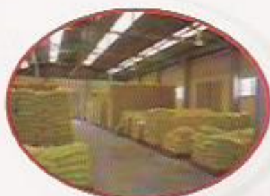
Figura 4: Estocagem de Ração