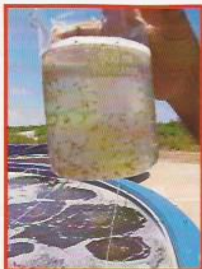
Figura 14: Checagem de Pl's.

A utilização de tanques berçários deve ser acompanhada de uma série de procedimentos quanto ao manejo de cultivo e de biossegurança.