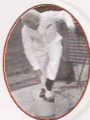
Figura 11: Sanitização de Calçados

As fotos de 9 a 11 apresentam etapas do processo de limpeza e assepsia de pessoal e de equipamentos.