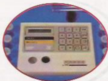
Figura 22: Fotocolorímetro

A figura 21 apresenta um Oxímetro (medição de Oxigênio dissolvido e temperatura) e a figura 22, um Fotocolorímetro (medição de alcalinidade, dureza, pH, amônia, nitrito, nitrato).