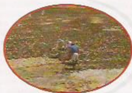
Figura 18: Revolvimento Manual