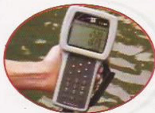
Figura 21: Aparelho de Mensuração de O.D.

A manutenção dos níveis ideais para os parâmetros de qualidade da água é essencial para evitar o desencadeamento de enfermidades.