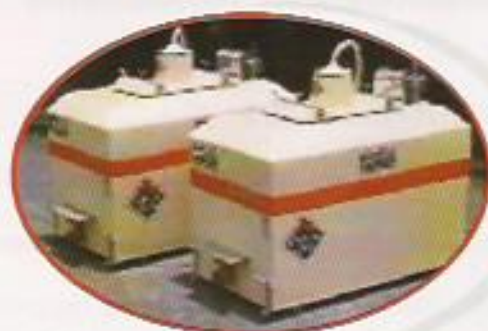
Figura 13: Caixas de Transporte de PL's.

Como medida de Biossegurança, as densidades usadas para o transporte de PL's (Tabela 2) devem ser diminuídas para minimizar o estresse dos animais durante esta operação. A temperatura deve ser adequada ao tempo do transporte, desta forma o metabolismo dos animais é reduzido e, conseqüentemente, se reduzem o consumo de alimentos, o oxigênio e as alterações no pH.