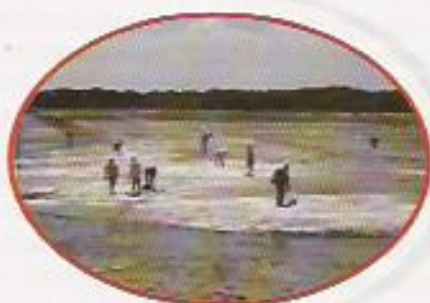
Figura 19: Distribuição Manual de Calcário

As fotos 16 a 19 apresentam etapas do processo de preparação do solo, desde o revolvimento até a calagem mecanizada e a manual