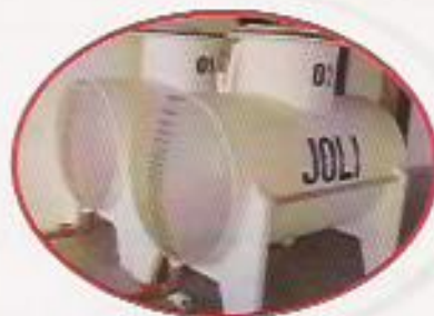
Figura 8: Submarinos de Transporte de P's

As fotos de 4 a 8 apresentam insumos, utensílios e equipamentos que devem ser adquiridos seguindo um controle rígido quanto à qualidade, ao uso eficiente a que se propõem e ao local adequado para armazenamento e fácil higienização.