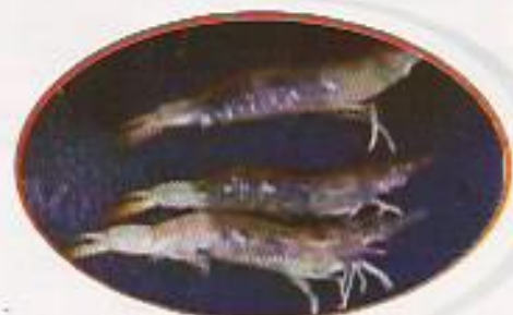
Figura 27: Grau QUATRO (G-04)

A tabela 12 sugere, como exemplos, o acompanhamento sistemático da análise de prevalência de IMNV em função dos sinais visuais apresentados nas fotos.